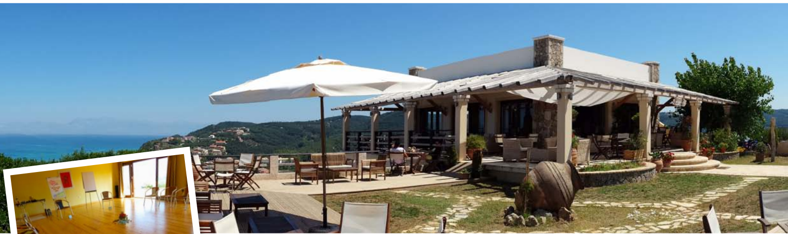
Der Seminarraum mit Blick auf die Bucht von Agios Stefanos. Besser geht's nicht!