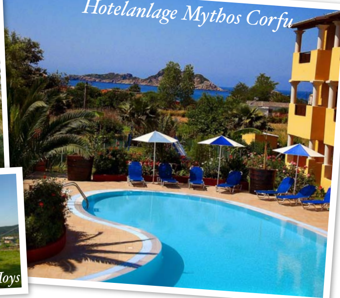
Hotelanlage Mythos Corfu